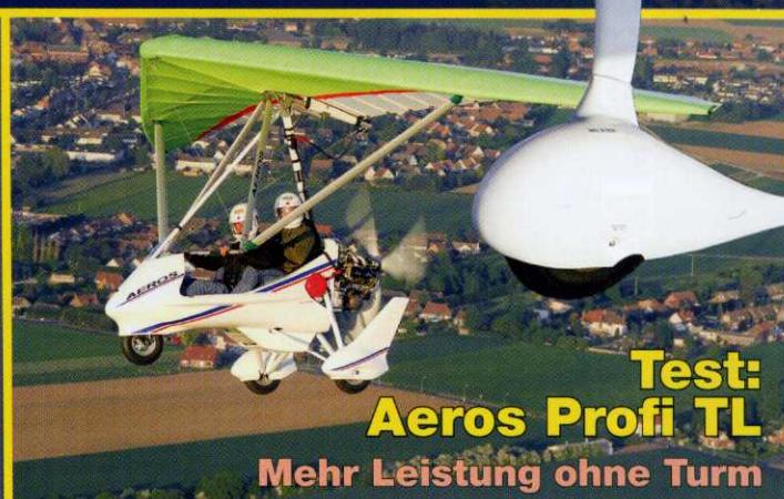
Test: Aeros Profi TL Mehr Leistung ohne Turm