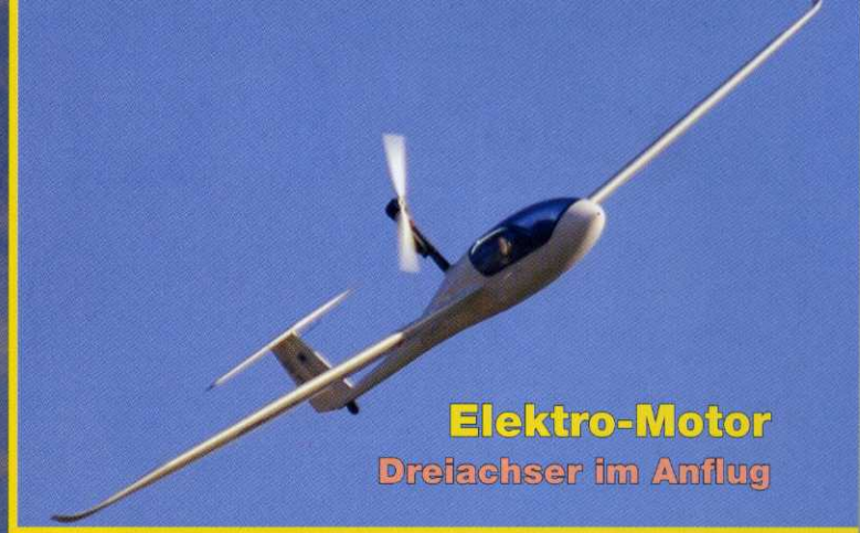
Elektro-Motor Dreiaxser im Anflug

› Test: UL-Motorsegler Brandeis Banjo Duo